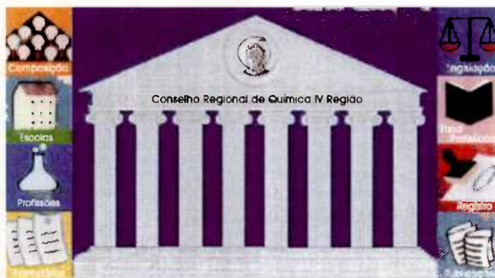
Em operação há um ano, site do CRQ-IV presta vários serviços

Para participar, envie uma carta (ou um e-mail) aos cuidados da Assessoria de Comunicação. Do lado de fora do envelope (ou no campo "assunto" ou "subject" do e-mail) escreva: "Pesquisa Internet". É muito importante que você também informe o número de seu registro ou, sendo estudante, o número do seu cadastro.