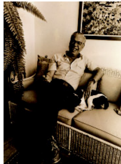
Castro, em foto produzida em 1984