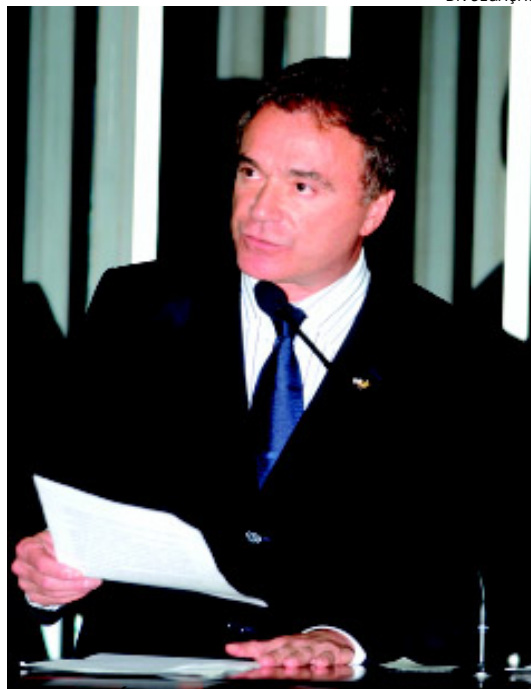
Senador Alvaro Dias, autor do projeto